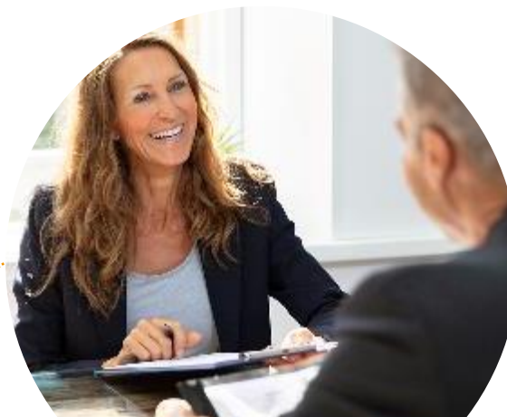
Le Programme REPÈRE